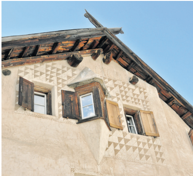
Blick auf die Frontfassade der Chesa Rechsteiner (links) und auf eine Betonwand des Schulhauses Puoz.