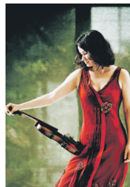
Bekannt für ihre eigenwillige Spielweise: Patricia Kopatchinskaja tritt am diesjährigen Engadin Festival auf.